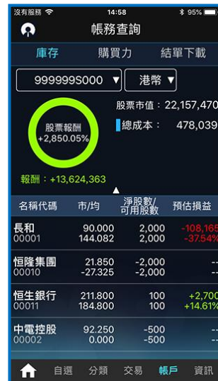
「實時串流」版本之庫存