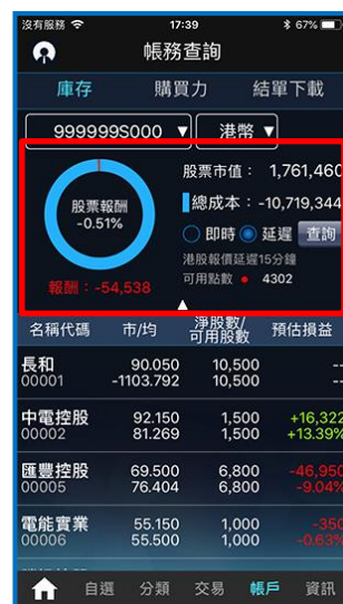
「計次查詢」版本之庫存